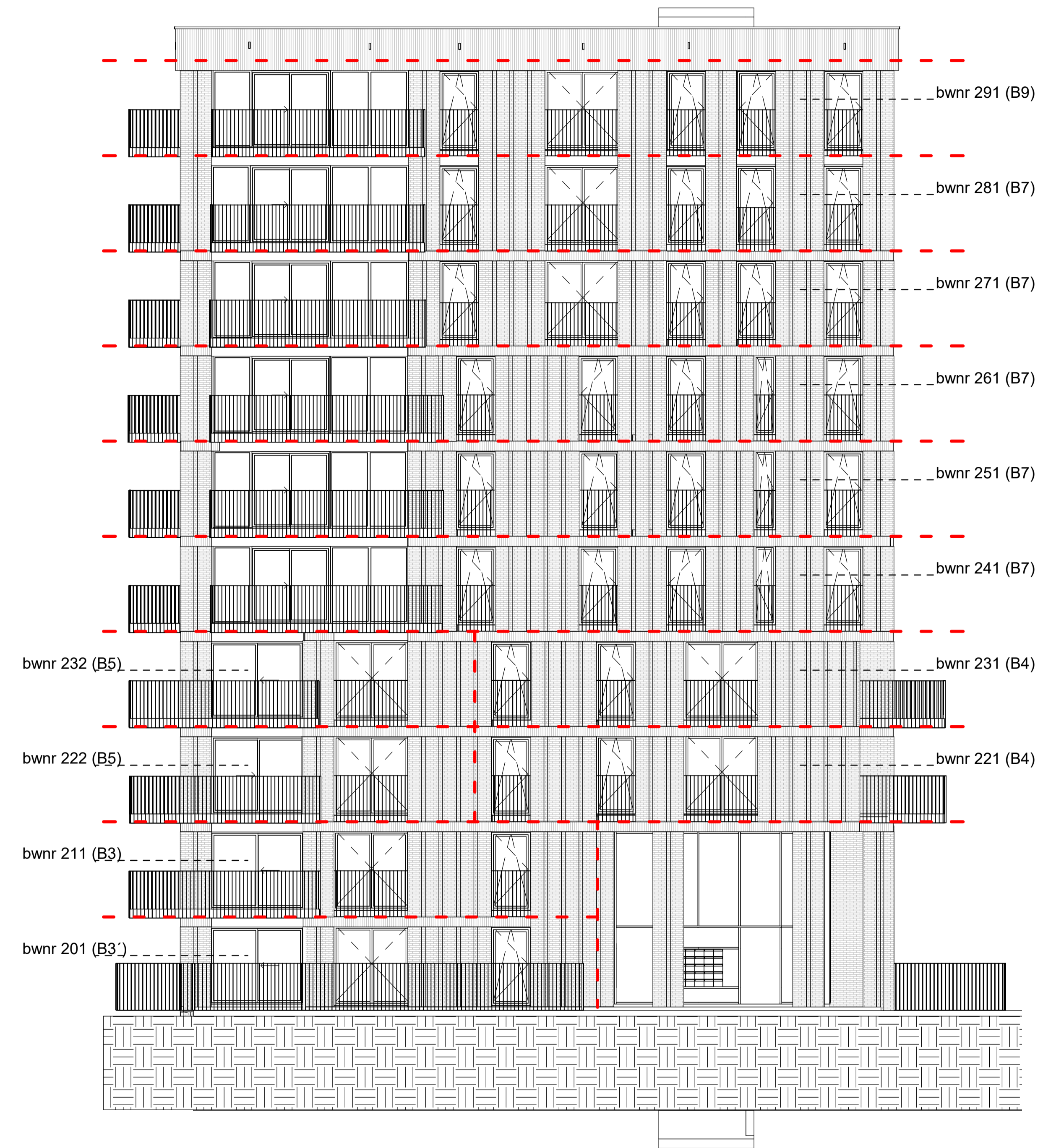
noordgevel toren 2