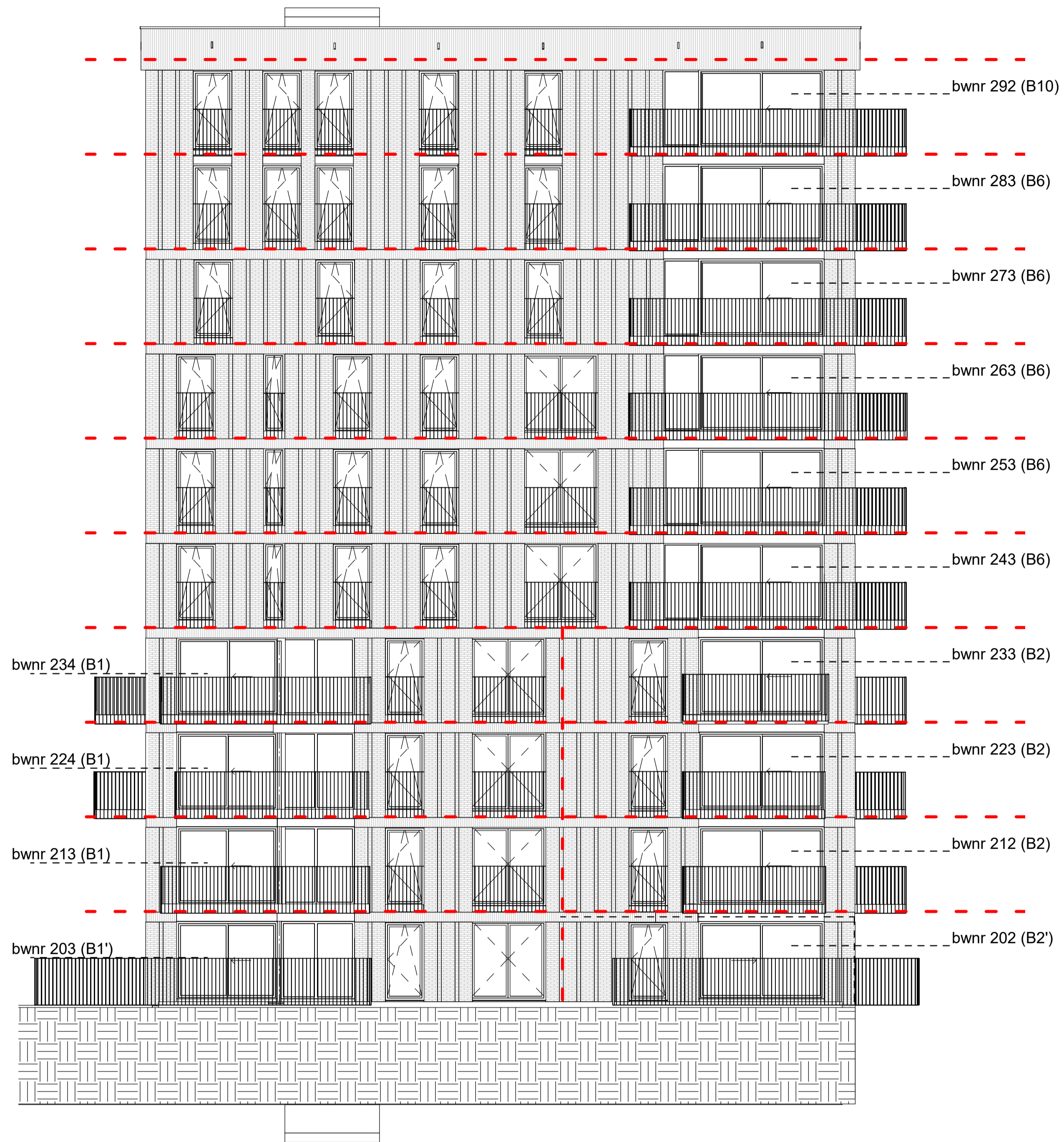
zuidgevel toren 2